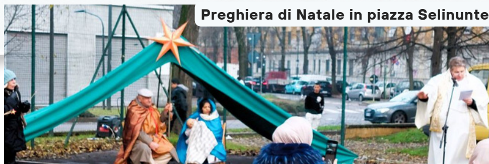
Preghiera di Natale in piazza Selinunte