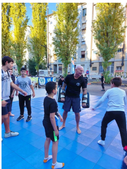
attività sportive presso ex mercato di piazza Selinunte