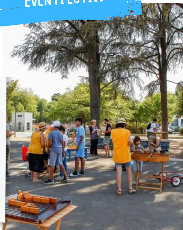
UNA COMUNITÀ ANIMATA